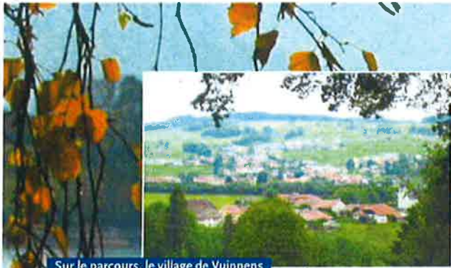
Sur le parcours, le village de Vuippens