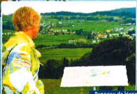
Panneau de légendes

Plus de 20 légendes gruériennes illustrées à lire dans un cadre entre pâturages, lac, Sionge et forêt. Panoramas et historiques de la région