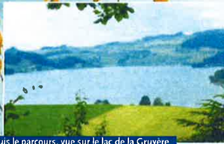
Depuis le parcours, vue sur le lac de la Gruyère